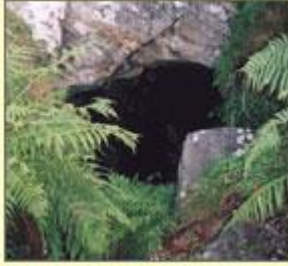
"Mieri lle bu mawredd" Yn y lefel hon y darganfuwyd bonansa aur Clogau yn 1861

Mae Cymru'n enwog am ei haur, yn bennaf o gwmpas Dolgellau - y "Klondyke Cymreig" yn ôl papurau newydd y 19eg. ganrif - ac yn Nolaucothi ger Pumsaint. Gallwn brynu gemwaith o aur y Clogau hyd heddiw, a'r un aur sydd ym modrwyau priodas y teulu brenhinol. Dolaucothi ydy'r unig fan y gallwn fod yn hollol bendant y buodd y Rhufeiniaid yn cloddio am aur, er bod traddodiad iddynt fod wrthi mewn manau eraill. Eto, mae enwau yn rhoi lle i ni ddyfalu. Olion gwaith plwm sydd yng nghwm Llannerch-yr-aur, ond mae'r enw'n awgrymu y gallai rhywbeth mwy gwerthfawr fod wedi dod oddi yno ar un adeg. Er bod pyrites haearn (aur y ffwl) yn debyg i aur o ran lliw, gellir ei adnabod wrth ei grisialau ciwbig, a byddai'r mwynwyr yn gwybod hynny'n dda.