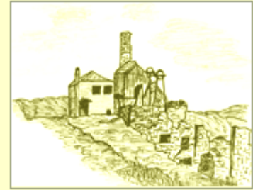
Hen waith plwm y Cyffty ym 1963

Er bod y safle erbyn hyn yn daclus a diogel, gyda phaneli gwybodaeth diddorol i ddehongli 'r olion, meddyliwch cymaint gwell fyddai gweld y lle fel yr oedd. Yn ffodus, mae mwy o lawer ar ôl yn hen weithfeydd Hafna a Llanrwst, ond yr oedd y Cyffty'n unigryw - tan i fois y deinameit ddod hebio.