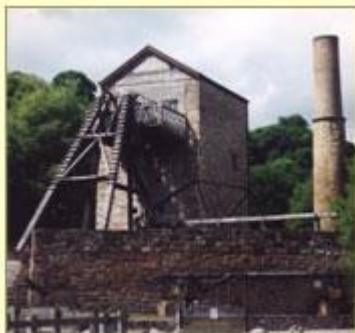
Ty injan y Meadow, Minera, Wrecsam

Cymharwch y Cyffty heddiw â hen waith plwm Minera ger Wrecsam. Yno cafodd y safle ei archwilio a'i ddiogelu at y dyfodol fel rhan o safle hanesyddol a pharc gwledig, lle gall y cenedlaethau i ddod werthfawrogi 'r hyn a fu.