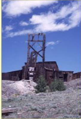
Gwaith aur y Duncan, Wyoming. A fu Cymry yma?

Mae Cymru'n enwog am ei haur, yn bennaf o gwmpas Dolgellau - y "Klondyke Cymreig" yn ôl papurau newydd y 19eg. ganrif - ac yn Nolaucothi ger Pumsaint. Gallwn brynu gemwaith o aur y Clogau hyd heddiw, a'r un aur sydd ym modrwyau priodas y teulu brenhinol. Dolaucothi ydy'r unig fan y gallwn fod yn hollol bendant y buodd y Rhufeiniaid yn cloddio am aur, er bod traddodiad iddynt fod wrthi mewn manau eraill. Eto, mae enwau yn rhoi lle i ni ddyfalu. Olion gwaith plwm sydd yng nghwm Llannerch-yr-aur, ond mae'r enw'n awgrymu y gallai rhywbeth mwy gwerthfawr fod wedi dod oddi yno ar un adeg. Er bod pyrites haearn (aur y ffwl) yn debyg i aur o ran lliw, gellir ei adnabod wrth ei grisialau ciwbig, a byddai'r mwynwyr yn gwybod hynny'n dda.