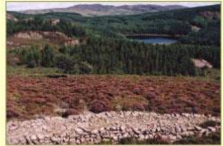
Tramffordd i waith manganis Cwm Mynach ger Dolgellau

Mae pawb yn gyfarwydd â'r tomenni sbwriel amlwg ac â lluniau o lowyr a chwarelwyr wrth eu gwaith, ond dros y canrifoedd bu llawer o gloddio am fwynau hefyd. Weithiau mae'r hen safleoedd yn hawdd i'w gweld - anodd yw anwybyddu Mynydd Parys ar Ynys Môn neu olion gwaith Cwm Ystwyth - ond yn aml rhaid chwilio am domenni o bridd a cherrig "gwahanol" i ddangos ceg twnelau neu loriau trin y mwyn.