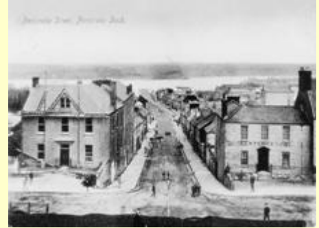
Stryd Penfro, Doc Penfro. Marc post: Rhagfyr 23 1905