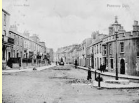
Heol Fictoria, Doc Penfro

Dyma ddau hen gerdyn post yn dangos dwy o strydoedd Doc Penfro rhywbryd rhwng diwedd yr 1890au a chanol y 1900au.