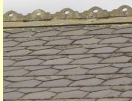
Llechi o'r 19eg ganrif, y cawiau yn denau a'r naddu'n gywrain